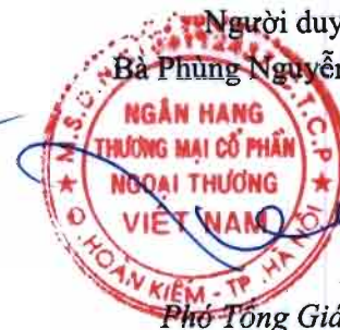
Phó Tổng Giám đốc