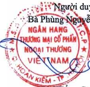
Phó Tổng Giám đốc